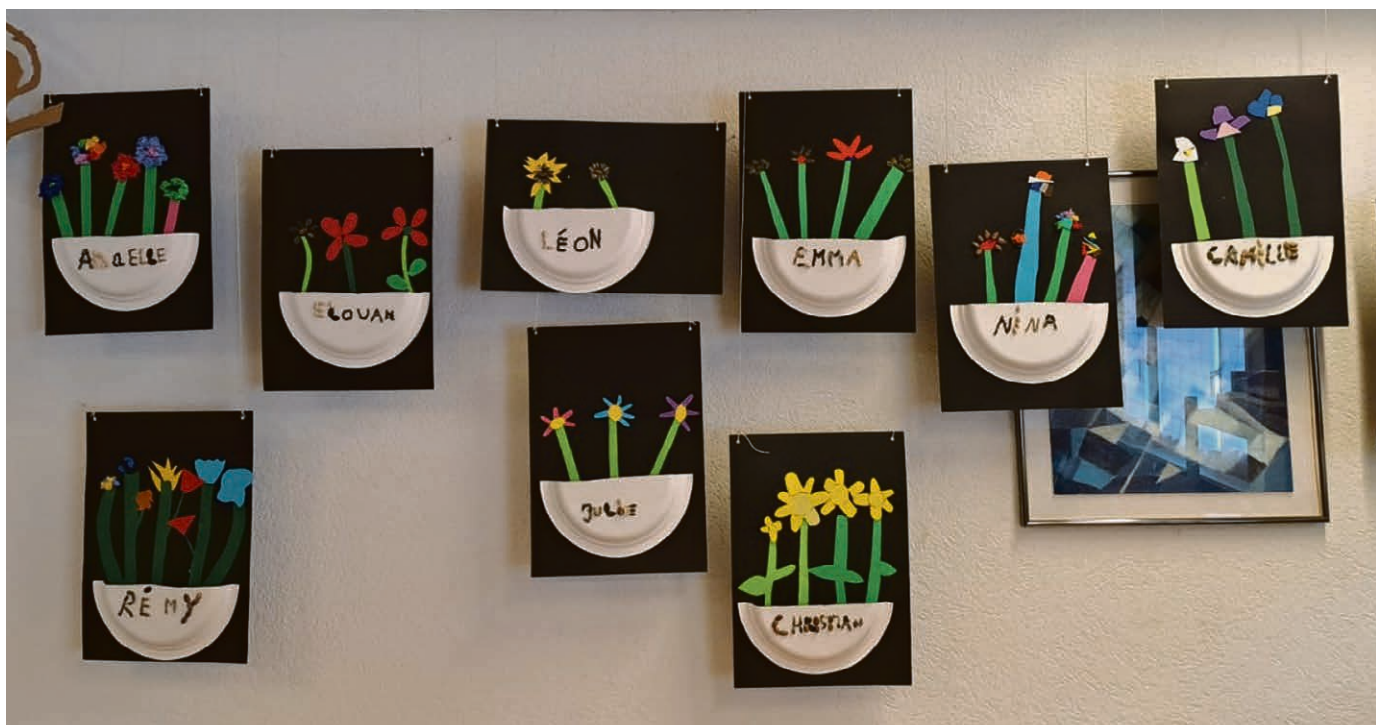
Les enfants du culte de l'enfance.

Une réflexion est en cours pour l'an prochain. Nous aimerions garder la formule du vendredi de 17h à 20h , avec repas chaud et recueillement à la fin à l'église. Nous avons besoin de vous !