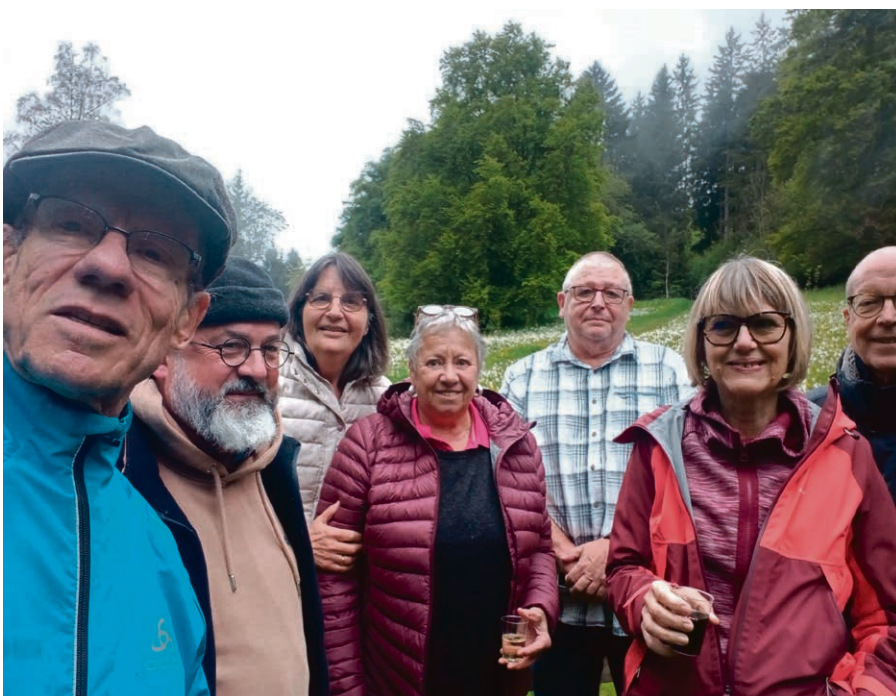
Retraite du nouveau conseil paroissial au Mont-Pèlerin, fin mai.

▲ « Pensées », Père Marie Eugène, éditions du Carmel