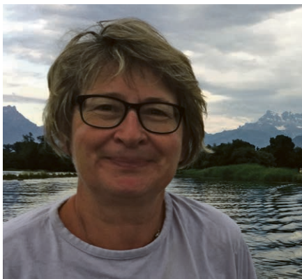
Au revoir et merci.

Après six années dans la paroisse, nos chemins vont se séparer, probablement le 1 er septembre. Je vous dis merci pour toutes ces années partagées, tous les bouts de chemin que j'ai pu vivre avec chacun de vous, croître, grandir, apprendre. Je vous demande pardon pour ce que j'ai fait de travers, ou une parole qui est partie trop vite, jamais je n'ai voulu blesser, je vous prie de m'excuser si cela