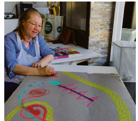
Les participantes et les participants peuvent laisser libre cours à leur créativité le temps d'une après-midi.