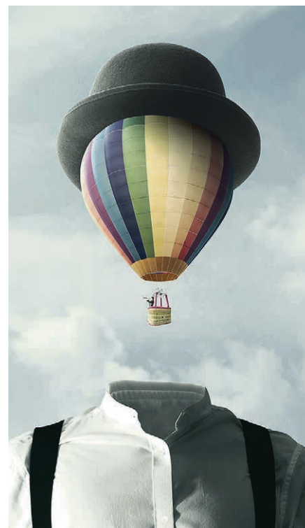
La nouvelle gouvernance régionale est un souffle d'innovation pour la Région Riviera-Pays d'Enhaut.