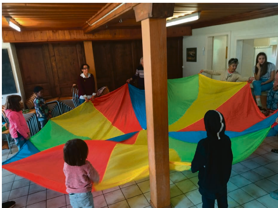
Camp de Culte de l'enfance à Vers-l'Église avec les enfants de notre paroisse et celle de Montreux-Veytaux.

Vendredis 28 juin, 26 juillet et 30 août, à 18h30 , chapelle de Brent. Moment de musique et de méditation.