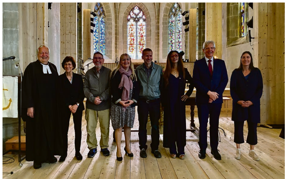
De nombreux défis attendent notre nouveau conseil paroissial installé le 26 mai 2024. Priez pour lui.