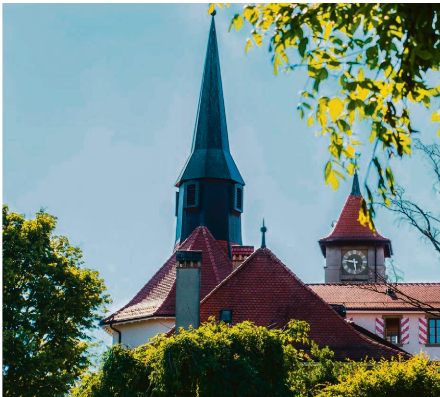
Depuis 20 ans, l'église du Prieuré pointe à nouveau fièrement son clocher vers le ciel.