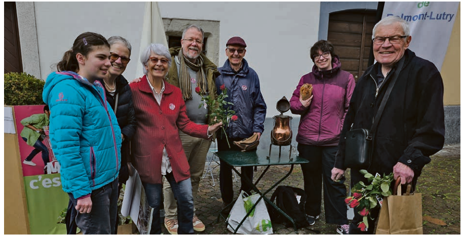
Vente de roses dans le cadre de la campagne œcuménique Action de carême/EPER.

guet a reçu le signe du baptême pour être accueilli liturgiquement dans la famille des enfants de Dieu.