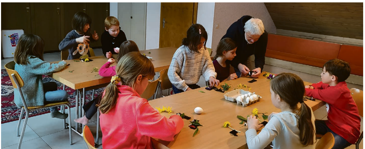
Pâques en pratique.

Chaque vendredi, une lettre de nouvelles électronique annonce les événements à venir. On peut s'y abonner via le site internet de la paroisse : eerv.ch/saint-saphorin .