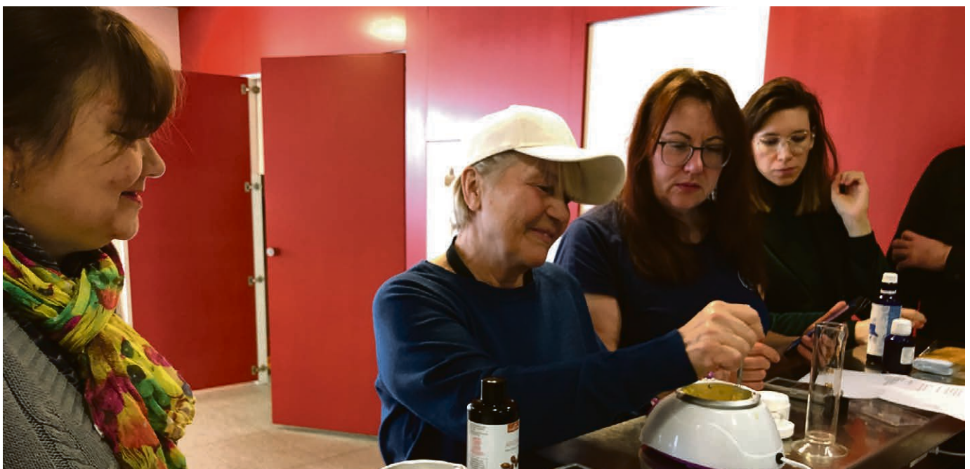
Participation de plusieurs Ukrainiennes aux sorties nature.