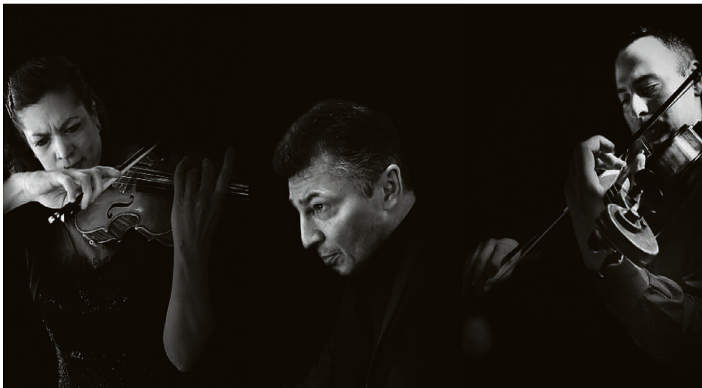
Le Trio des Variations symphoniques.

Infos sur www.cret-berard.ch/activites . ▲