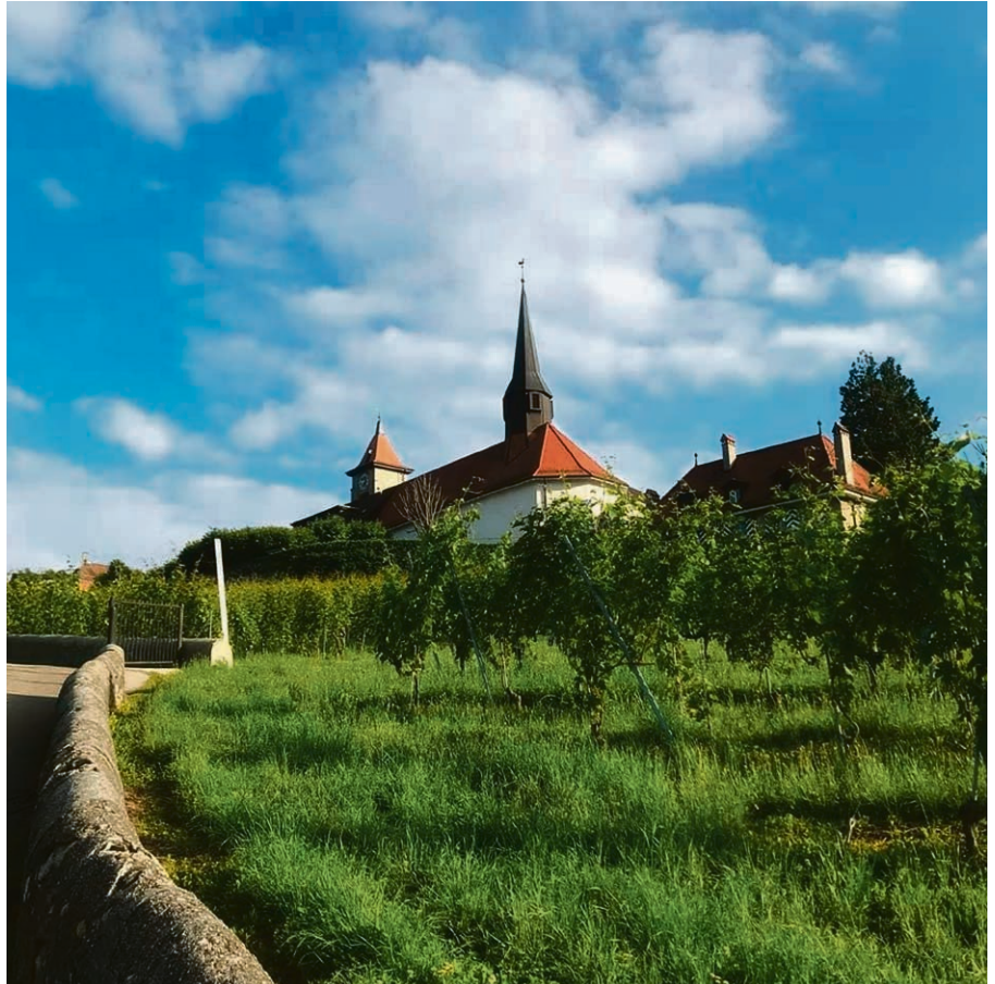
20 ans, une église chère au cœur des Pulliérans.

Après trois ans de travaux à la suite de l'incendie criminel de l'église du Prieuré le 16 avril 2001, les paroissiens retrouvaient leur lieu de culte à l'occasion d'une grande fête en juin 2004. Pour marquer les 20 ans de la reconstruction de notre belle église, si chère au cœur des Pulliérans qui ont vécu tant d'événements dans ces murs séculaires, nous nous retrouverons le dimanche 26 mai 2024 . Après un culte d'action de grâces à 10h , un apéritif et une partie officielle seront organisés sur l'esplanade en cas de beau temps, ou à la Maison Pulliérane. Une plaquette historique sera éditée tout spécialement pour l'occasion, et une œuvre d'art marquant cet anniversaire sera inaugurée pendant le culte (œuvre inédite des artistes Ignazio Bettua, Cécile Henchoz et Sonia Morel). Pour davantage d'informations, la « une » de ce cahier régional