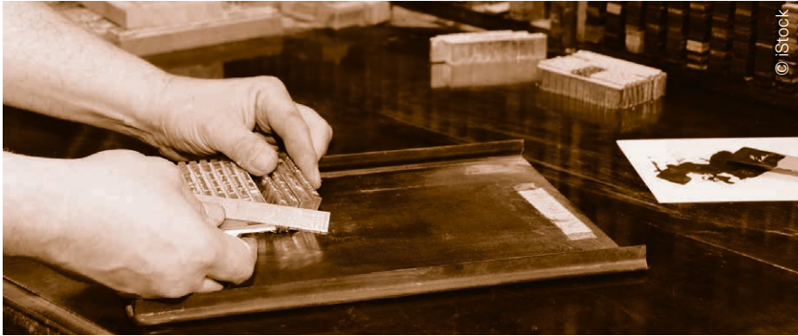
La Linotype permettant la saisie au clavier et la fabrication de lignes de caractères en plomb a révolutionné l'imprimerie de la fin du XIX e siècle. Elle a été utilisée jusqu'à la fin des années 1970.

PATRIMOINE « Les paroles s'envolent, les écrits restent », promettait Horace, mais le poète latin ne connaissait pas les périodiques : journaux et magazines qui après lecture finissent bien souvent comme réceptacle des épiluchures en cuisine, une fois que la date inscrite en une est dépassée. Heureusement, depuis 2012, la