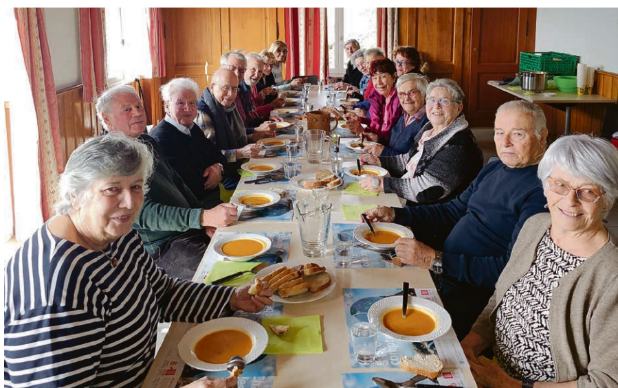
Une soupe de carême dans le partage.

Nous avons donc besoin de vous, lecteurs, lectrices du « Réformés ». Comment percevez-vous ce journal, comment le faire évoluer, l'améliorer, selon vous quels sont les qualités et les défauts de ce magazine, etc. Afin de montrer l'intérêt que nos paroisses portent au « Réformés », nous espérons que vous serez nombreux à vous inscrire pour cette rencontre auprès du secrétariat de Pully-Paudex, 021 728 04 65 ou paroisse.pully@bluewin.ch .