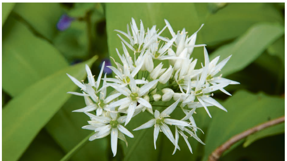
Partons à la découverte de l'ail des ours.

Inscription: cerv.ch/lavaux ou 0766935033 ▀