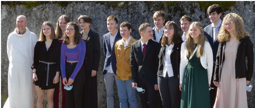
Rameaux, volée 2020.

Organisée par correspondance, l'Assemblée paroissiale a validé le rapport d'activité et les comptes 2020. Merci à toutes les personnes qui s'engagent pour la vie de notre communauté !