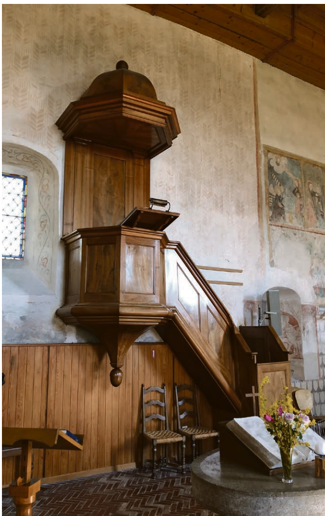
La chaire de Ressudens.

Et le reste : pour ceux de Grandcour, Chesard et Ressudens.