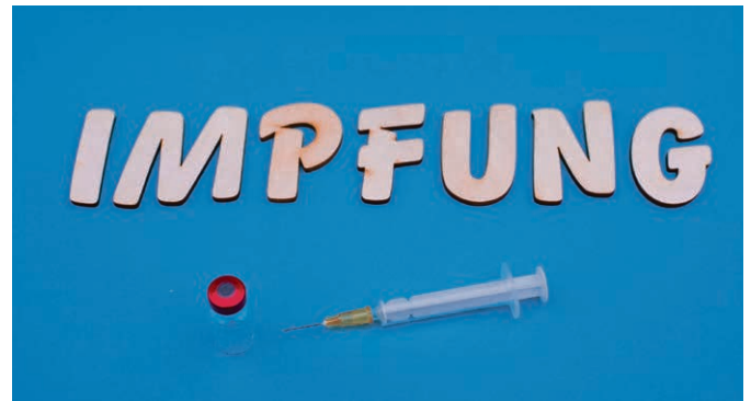
Aktuelles Thema.