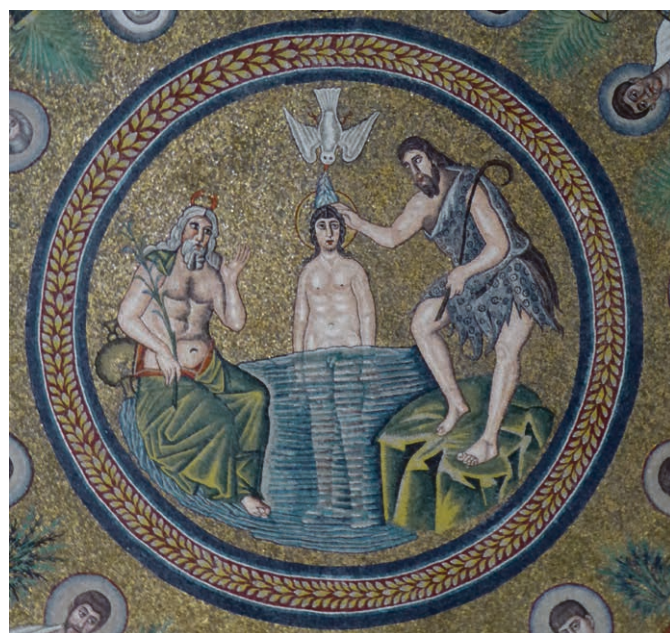
Ravenne. Baptistère des ariens.

Vendredi 7 mai, à 19h15, à Saint-Etienne. Prière de Taizé. A 20h, au Poyet, suite de la soirée avec les jeunes.