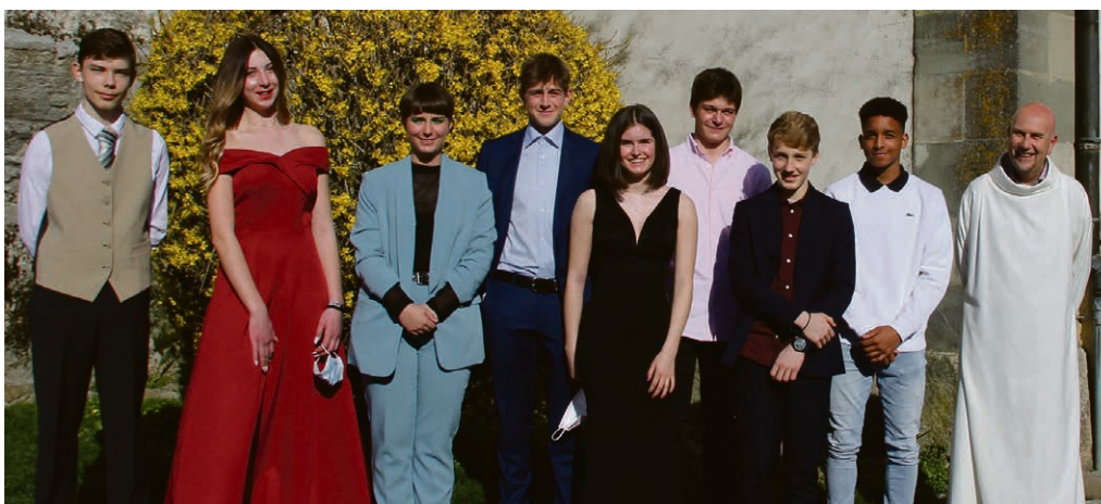
Rameaux, volée 2021.