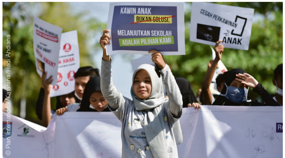
« Ne mariez pas un enfant. » Une campagne de PLAN international contre le mariage forcé en Indonésie (2020).

D'ici 2030, les organisations internationales anticipent 13 millions de mariages d'enfants supplémentaires à la suite de fermetures d'écoles et d'une pauvreté accrue. La Suisse est aussi concernée : le Service contre les mariages forcés a accompagné 361 situations en 2020, soit 14 de plus qu'en 2019. Sur ces 361 cas, 133 concernaient des mineur·e·s. « L'école à distance a exacerbé le contrôle intra-familial, et aussi les tensions autour de ces situations », constate Anu Sivaganesan, présidente de ce service. L'impossibilité des voyages à l'étranger aurait pu freiner ces situations. « Mais des unions ont tout de même été réalisées à distance, par Skype. » Si, juridiquement, un tel mariage n'a aucune valeur, « pour les personnes concernées et leur communauté, l'acte est valable, et sa signification est puissante et lie les gens », décrypte la juriste.