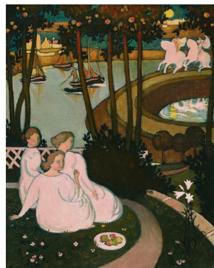
Maurice Denis, Légende de chevalerie (Trois jeunes princesses) , 1893 MCBA.

Cette recherche d'élévation, cet amour de la nature, de la femme et de l'art qui s'expriment dans les œuvres du peintre, placent le spectateur au-delà de l'agitation de la vie moderne, le laissant entre ciel et terre. ■ Elise Perrier