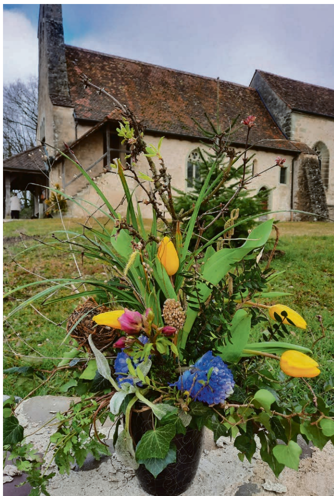
Le joli mois de mai.