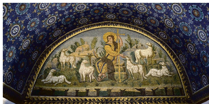
Ravenne, mausolée de Galla Placidia.