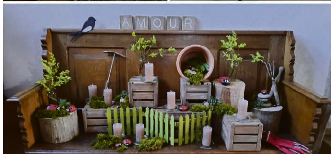
Décoration du temple de Combremont pour les Rameaux.

pierre, Mme Liliane Gaschen Cosendai le 4 mars à Dompierre, M. Jacques Rochat le 11 mars à Dompierre, M. Roland Mottet le 17 mars à Granges.