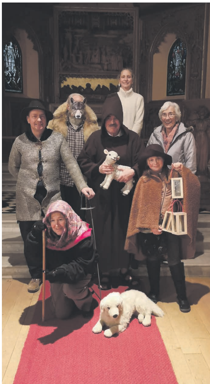
Saynète à Caux, Noël 2019.

une parole qui rassure ! Dans une situation où l'isolement et la solitude s'accroissent, parce que nous avons appris à intégrer les gestes barrières et limiter les contacts sociaux, Dieu est plus proche que jamais. Étrangement mais sûrement. Car ce « Emmanuel » résonne toujours à nouveau à chaque moment de la vie ! Que vous puissiez vivre les fêtes de Noël en harmonie avec vos proches et envisager l'année qui vient dans la confiance que des jours meilleurs sont déjà sur le point d'arriver ! ► Votre pasteur