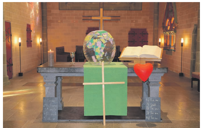
Dans le rétro - Souvenir du culte du 25 octobre.