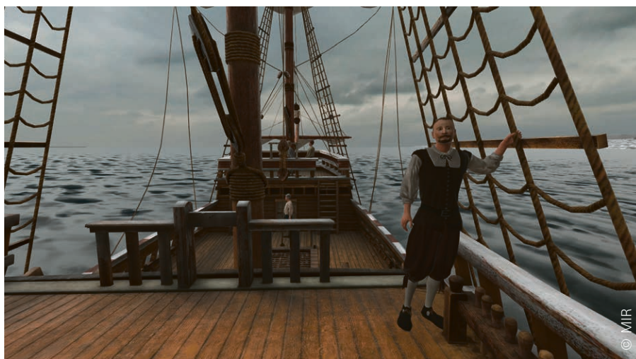
Une reconstitution du Mayflower embarque le visiteur grâce à la réalité virtuelle.

Cinq jours après l'ouverture de sa nouvelle exposition temporaire – « Calvin en Amérique » – le Musée international de la Réforme (MIR) doit fermer ses portes en raison des mesures sanitaires. Comment le musée affronte-t-il la crise ? Rencontre avec son directeur, Gabriel de Montmollin.