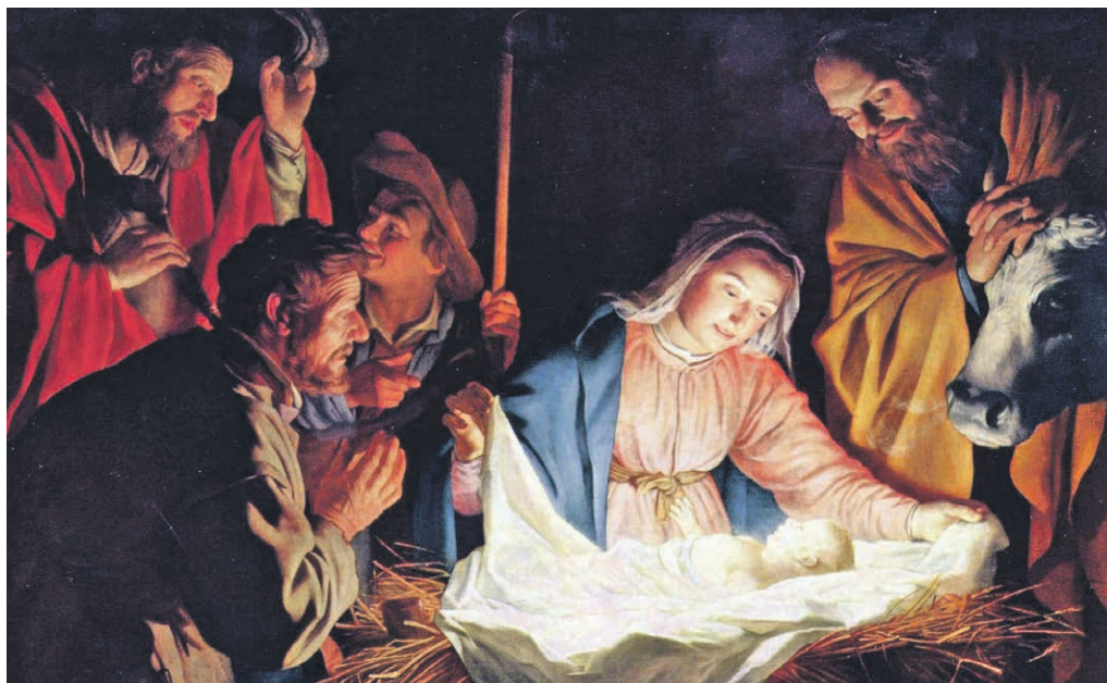
Noël: la vie malgré tout.