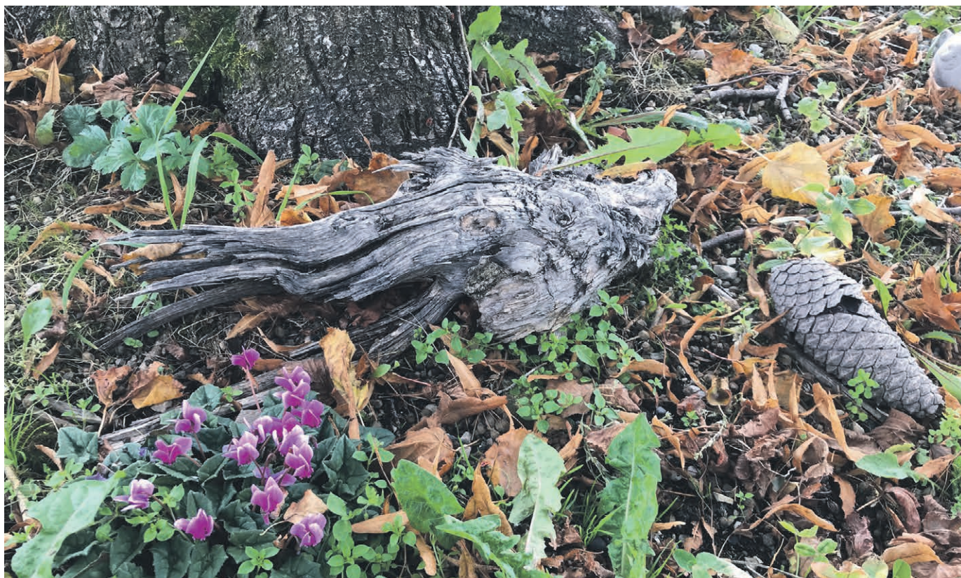
Espérance de Noël.

Elle n'a pas besoin d'être éclatante, grandiose, faite de mille lumières pour être forte... Même petite, elle peut devenir puissante, étonnante, lumineuse ! Comme une fleur qui pousse sans être impressionnée ni refreinée par les circonstances alentour !