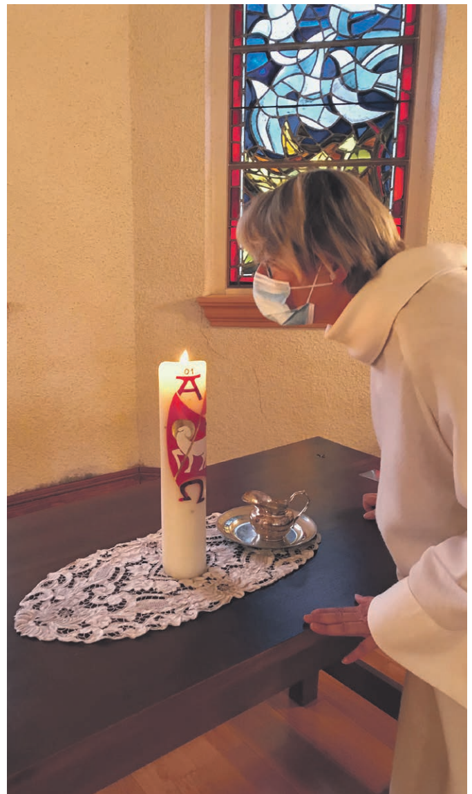
Cette petite flamme.