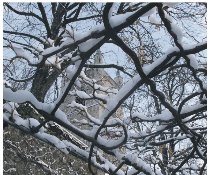
Même si c'est compliqué, garder confiance et espérance. © Ruth et Marcel Martin