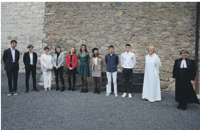
Culte de confirmations et baptêmes du 4 octobre à La Chiésaz.