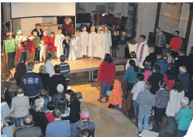
Les anges et les lutins parlent de Noël - Souvenir du Noël des enfants 2019.