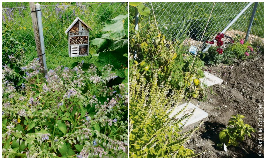
La parcelle du jardin de la paroisse de l'Espace Saint-Luc à Genève.