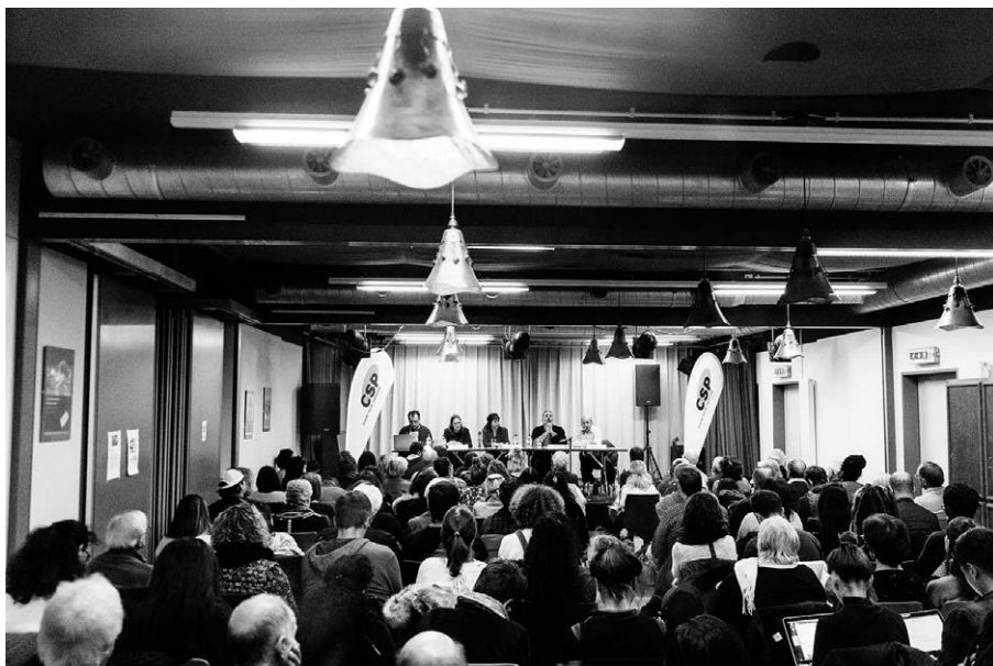
Réunion sur le sujet des sans-papiers en novembre 2018 à l'assemblée générale du CSP Vaud.

Le programme genevois qui a permis une régularisation inédite de personnes sans-papiers pourrait être repris dans d'autres cantons.