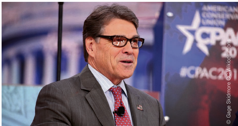
Rick Perry à la Conservative Political Action Conference de 2018.

Parmi les soutiens farouches au climatocéptique Donald Trump, une majorité chrétienne conservatrice, dont des évangéliques. En Suisse romande, leur discours ne passe pas. Au contraire.