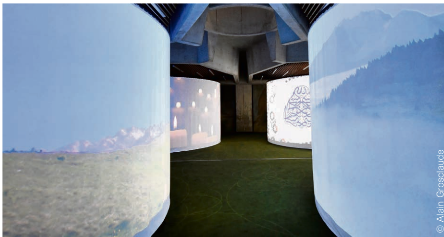
Les quatre alvéoles lumineuses qui accueillent les traditions chrétienne, israélite, musulmane et humaniste peuvent être déplacées afin de libérer l'espace pour des célébrations communes.

Ces quatre alvéoles lumineuses, esthétiquement très réussies, sont destinées à accueillir les traditions chrétienne, israélite, musulmane et humaniste. Elles peuvent facilement être déplacées afin de libérer la surface entière, pour des temps en commun. « Nous ne voulons pas rester côte à côte. Nous avons, bien évidemment, la volonté de faire des choses ensemble. Et nous sommes absolument en mesure de