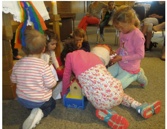
Haut-Talent Les enfants de l'Eveil à la foi découvrent l'histoire de l'arche de Noé.

HAUT-TALENT Invitation à la traditionnelle kermesse-fête du village à Froideville le dimanche 5 novembre . Célébration œcuménique, à 9h30 , suivie d'un brunch.