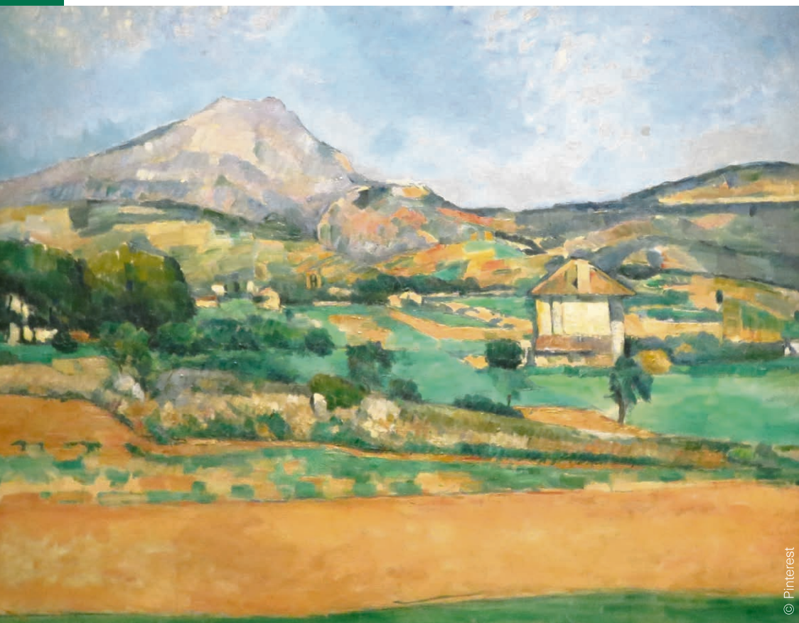
Une des nombreuses versions de La montagne Sainte-Victoire (1885) de Cézanne, exposée au musée Pouchkine de Moscou.