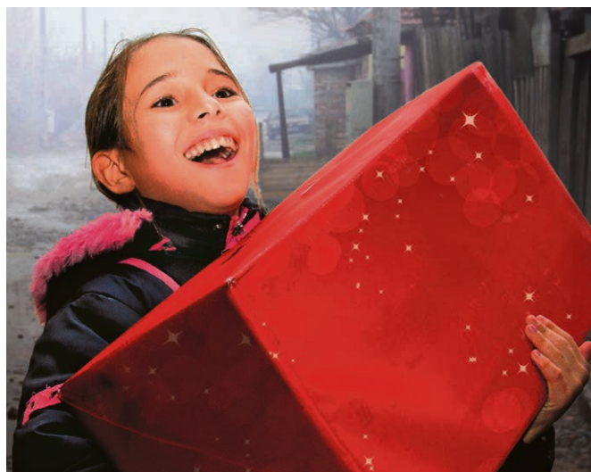
Crissier Cadeau de Noël!

Et puis ce sera aussi le plaisir d'entendre le chœur mixte de l'Harmonie qui, pour l'occasion, chantera un répertoire plutôt XIX e et romantique. Merci d'avance et bienvenue à toutes et tous.