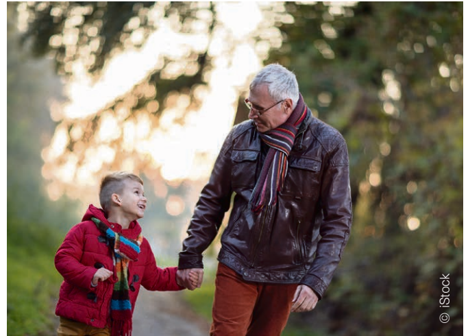
Les valeurs de la communauté favorisent le développement de l'enfant.

La chapelle de Servion a été transformée en espace pour les petits. Qu'apporte la transmission d'une religion au développement d'un enfant ? Réponses de la pédopsychiatre Meret Vallon.