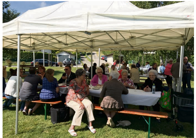
Ecublens - Saint-Sulpice Partage œcuménique.