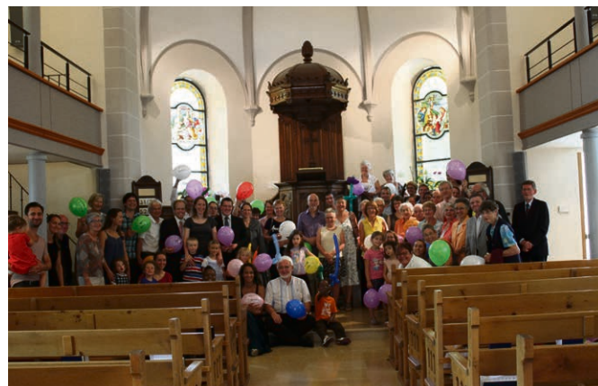
Bussigny - Villars - Sainte-Croix Un baptême, c'est la fête dans l'Eglise.