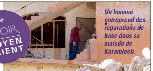
Un homme entreprend des réparations de base dans sa maison de Karamlech.

» Portes Ouvertes travaille en Irak depuis plus de vingt ans. Entre 2014 et 2016, en collaboration avec nos partenaires, nous avons soutenu des centaines de milliers de chrétiens avec du secours d'urgence.