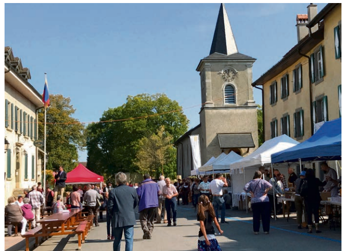
Ecublens - Saint-Sulpice Fête au Motty.