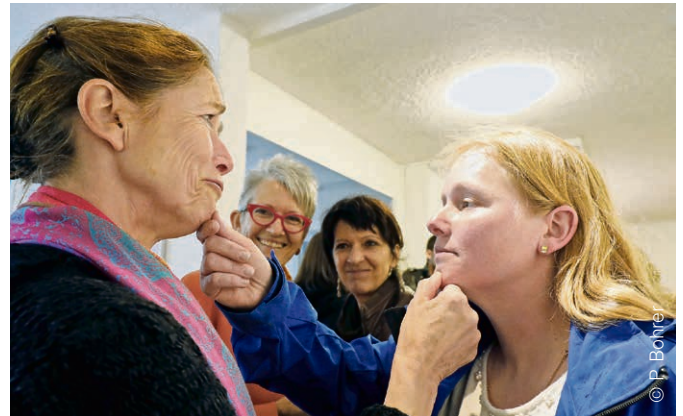
Les participants de la journée étaient invités à pratiquer le jeu du « Je te tiens, tu me tiens par la barbichette ».

Plusieurs ateliers ont eu lieu durant l'après-midi. Certains textes bibliques ont été revisités. On y a découvert les pointes d'humour juif qui traverse les récits du Nouveau Testament. Il a même été possible de rire à gorge déployée dans un atelier de yoga ! Des extraits de films burlesques n'ont pas manqué de faire sou-